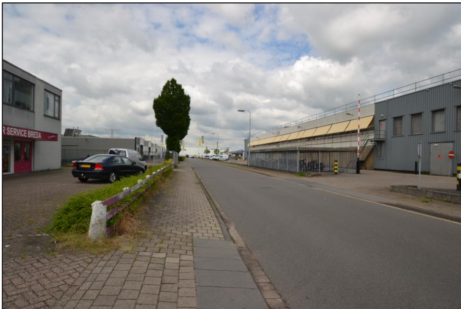
Straatbeeld en voorzijde