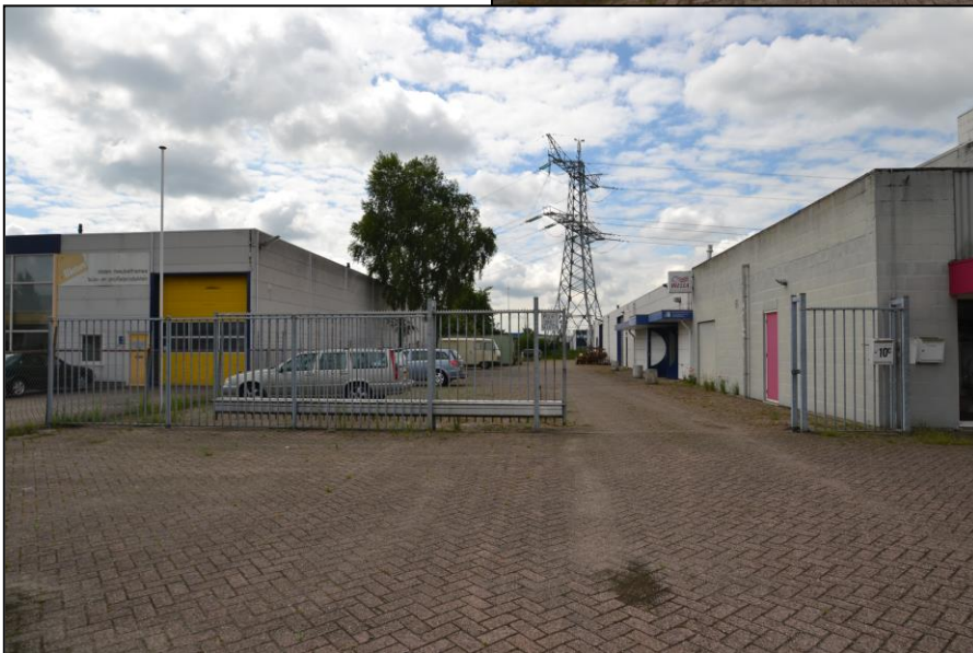
Straatbeeld en voorzijde