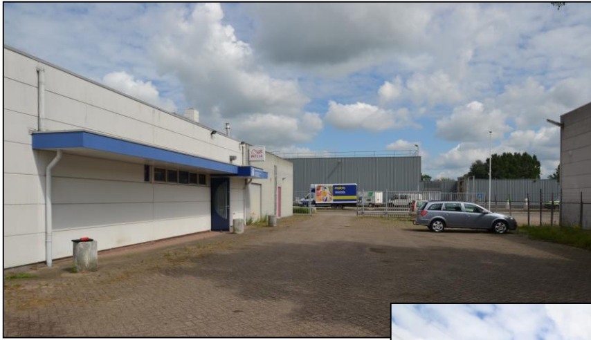
Straatbeeld en voorzijde